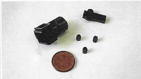
Erste Teile in fünf Arbeitstagen

Sprechen Sie mit uns, wir zeigen Ihnen Ihre Möglichkeiten mit acad prototyping auf!