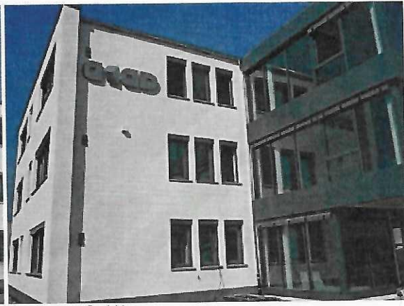
acad group GmbH

Seit dem 27. September 2017 sind wir für Sie unter folgender Adresse erreichbar: